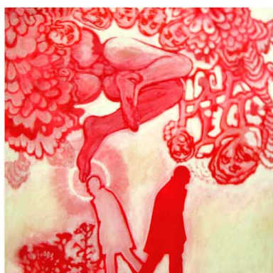
No. 381 Acryl/HF 100cm x 100cm Peter Dubina www.peterdubina.com