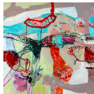
o.T. Acryl/LW 125cm x 150cm Ingrid Wieser-Kil www.wieser-kil.de