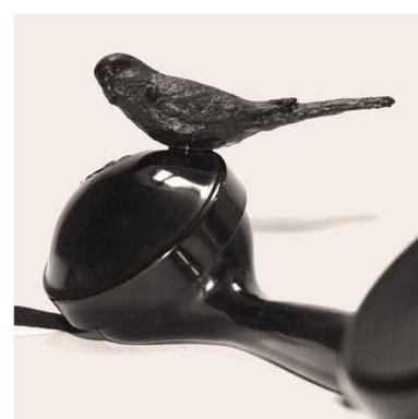
BLACKMAIL Mixed Media Susanne Weyand www.susanneweyand.de